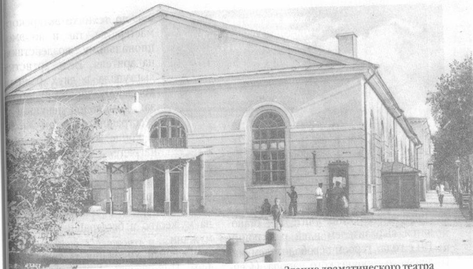
Здание драматического театра в годы войны 1941-1945 гг.